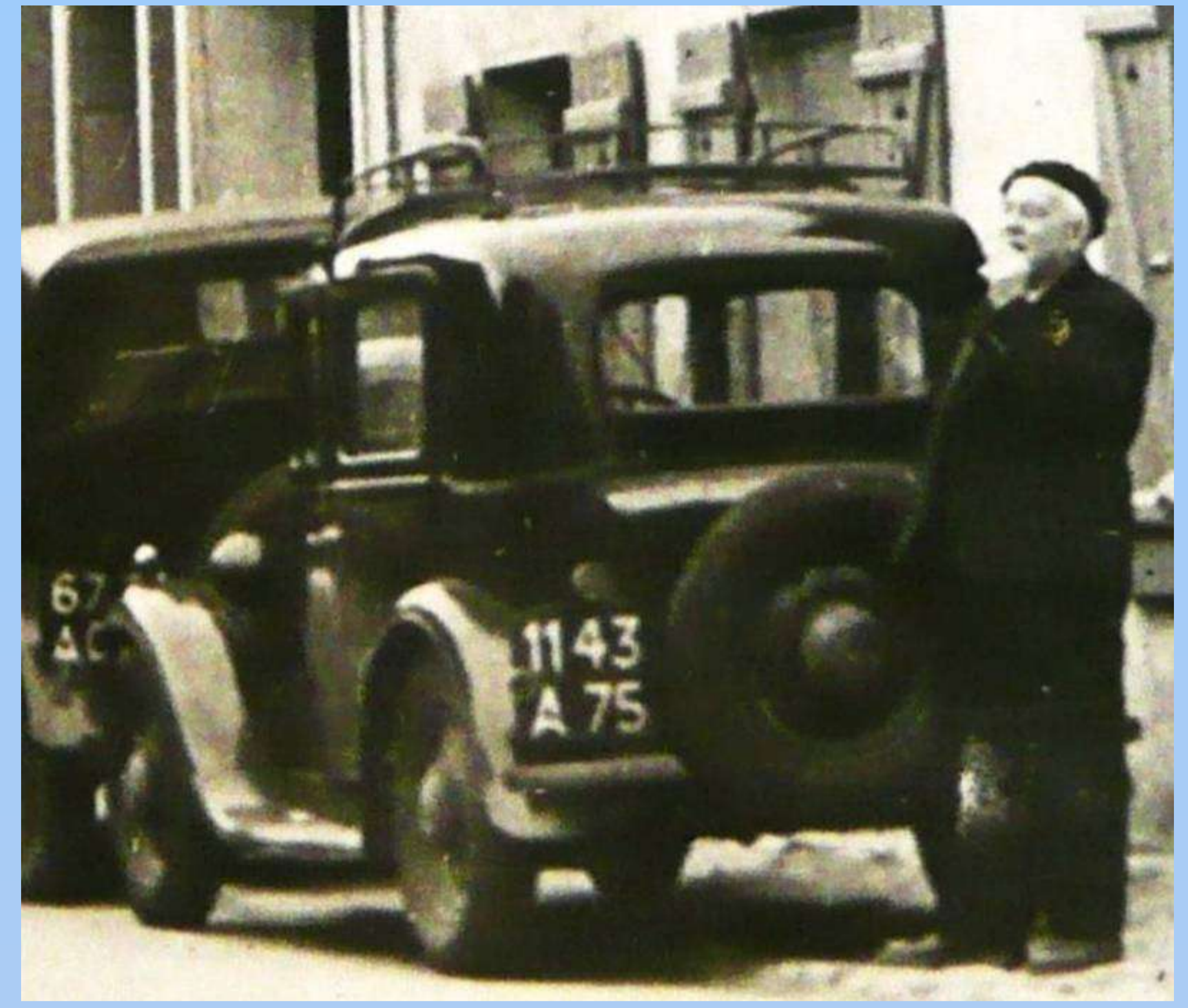
Seine, avril 1950

Deux autres départements les ont suivis en juillet 1954, à savoir le Pas-de-Calais et la Seine-Inférieure (dénommée Seine-Maritime depuis janvier 1955).