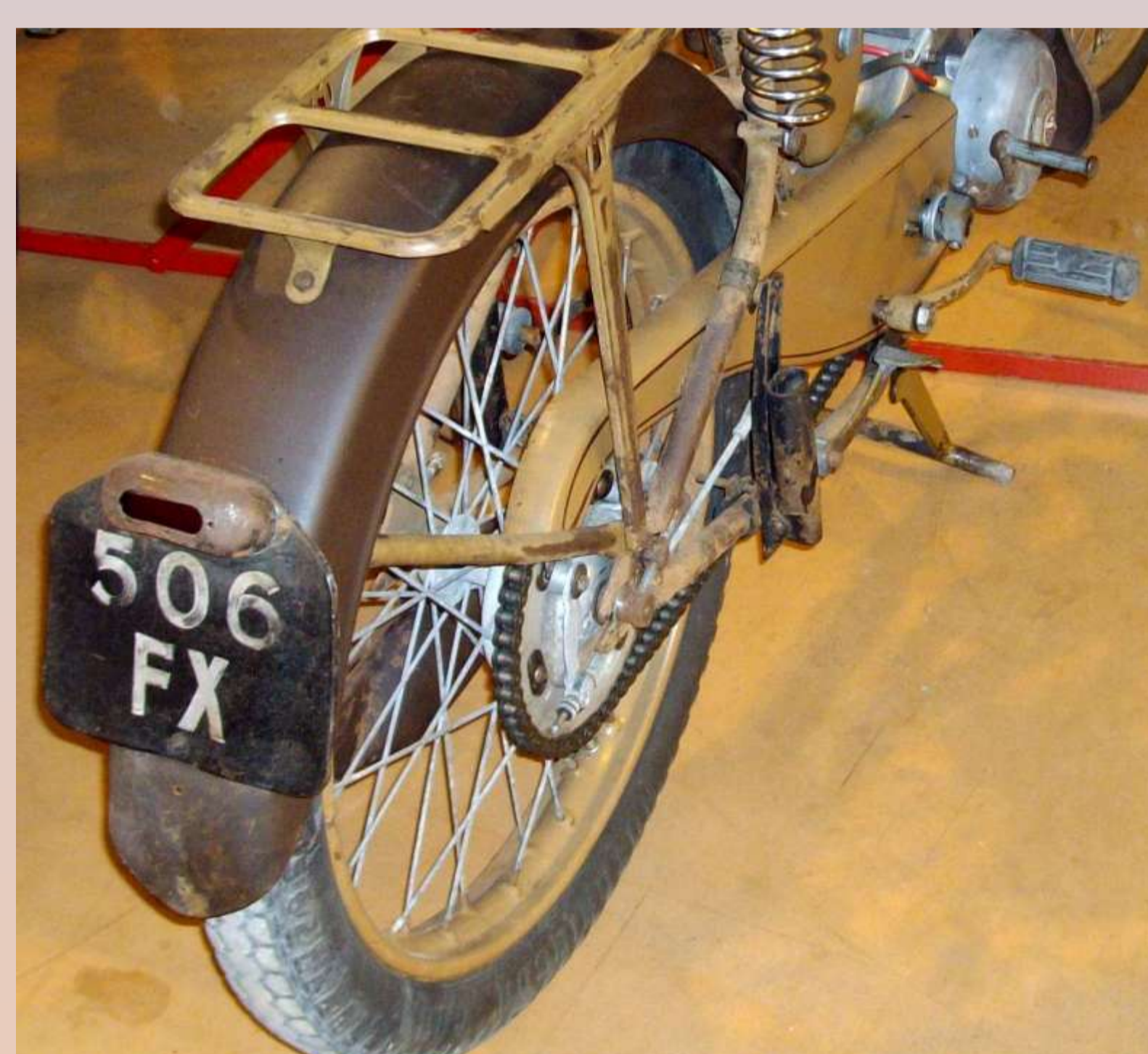
FX : Haute-Garonne, 1945 ou 1946

En septembre 1943, une troisième tranche fut réservée pour les deux-roues motorisés de faible puissance (hors motocyclettes), cette notion de tranche disparaissant en avril 1950. Ces trois tranches ont été prises à la fin de chaque série départementale.