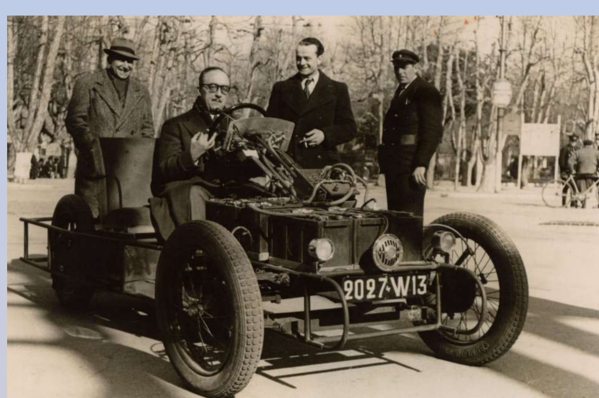
W13 : Arrondissement de Saint-Étienne

Parmi les groupes de lettres ont été exclues :