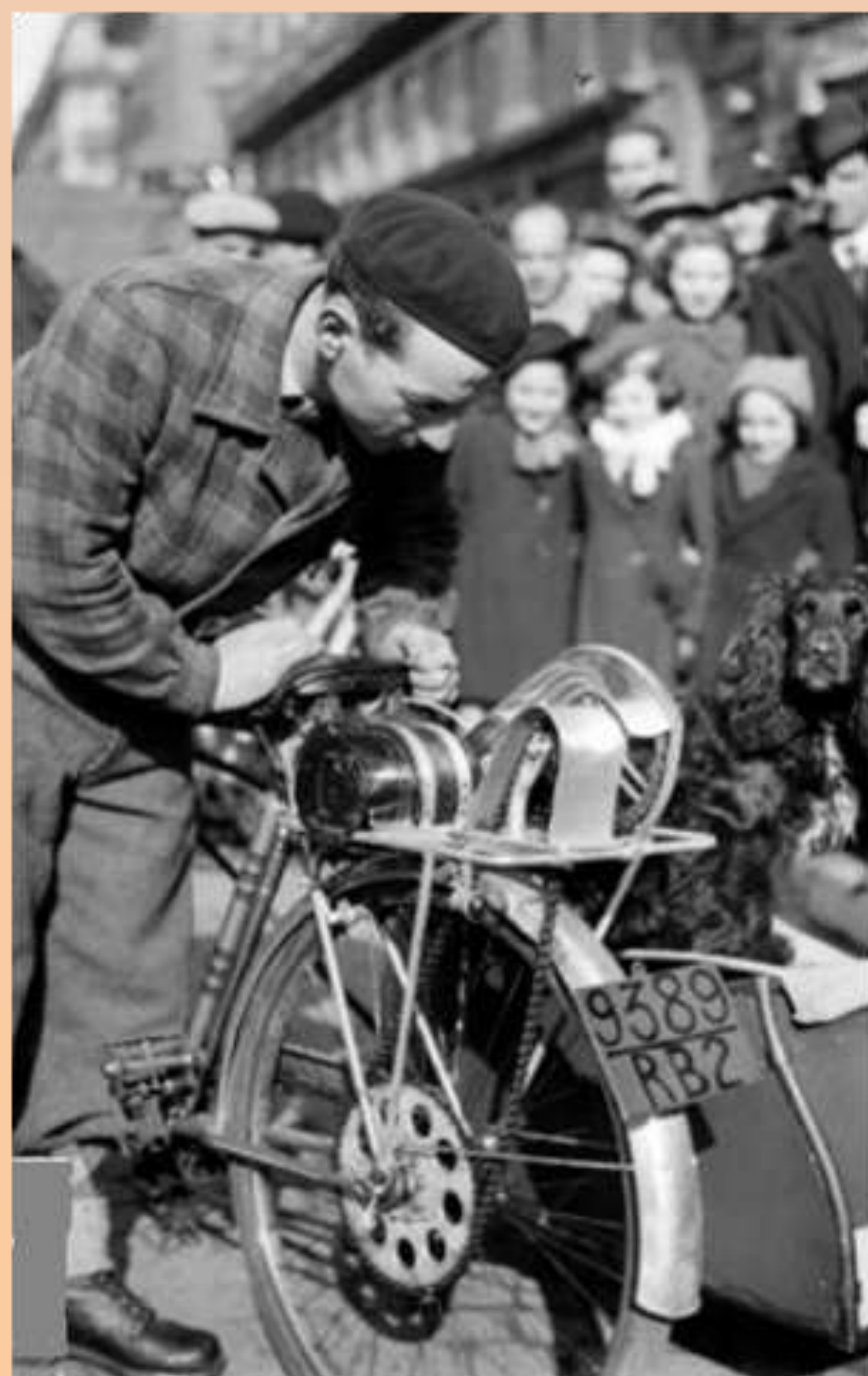
RB2 : Département de la Seine, décembre 1940

Sous l'Occupation fut également mis en place une série spécifique aux bicyclettes, lancée à la fin de 1940 et qui disparut dès la Libération. Elle se distinguait par des plaques jaunes et des caractères peints en noir, séparés d'une ligne et reprenant en doublon les immatriculations des véhicules à moteur.