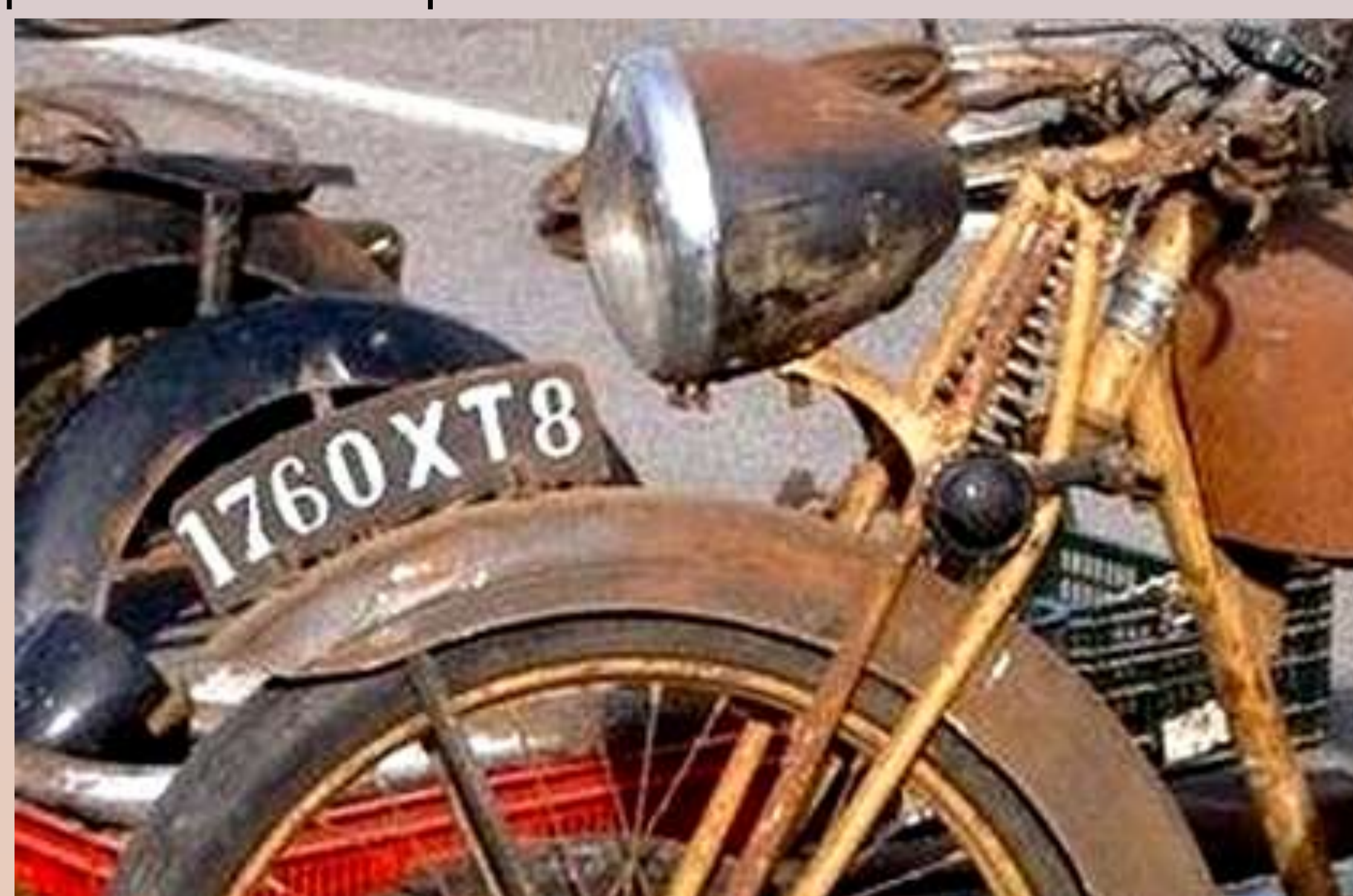
XT8 : Somme, janvier 1949

Sous l'Occupation fut également mis en place une série spécifique aux bicyclettes, lancée à la fin de 1940 et qui disparut dès la Libération. Elle se distinguait par des plaques jaunes et des caractères peints en noir, séparés d'une ligne et reprenant en doublon les immatriculations des véhicules à moteur.