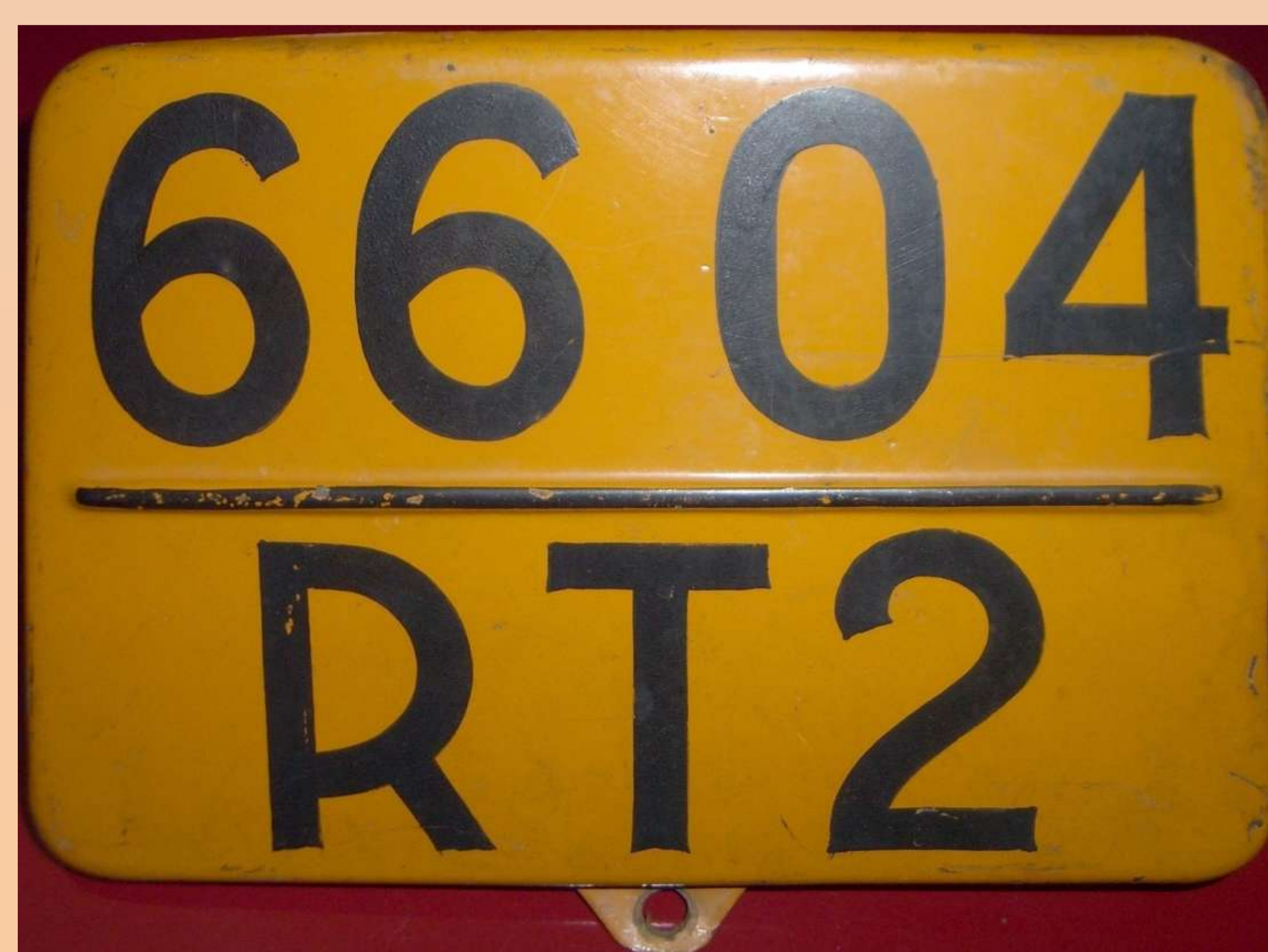
RT2 : Bicyclette du département de la Seine, 1944