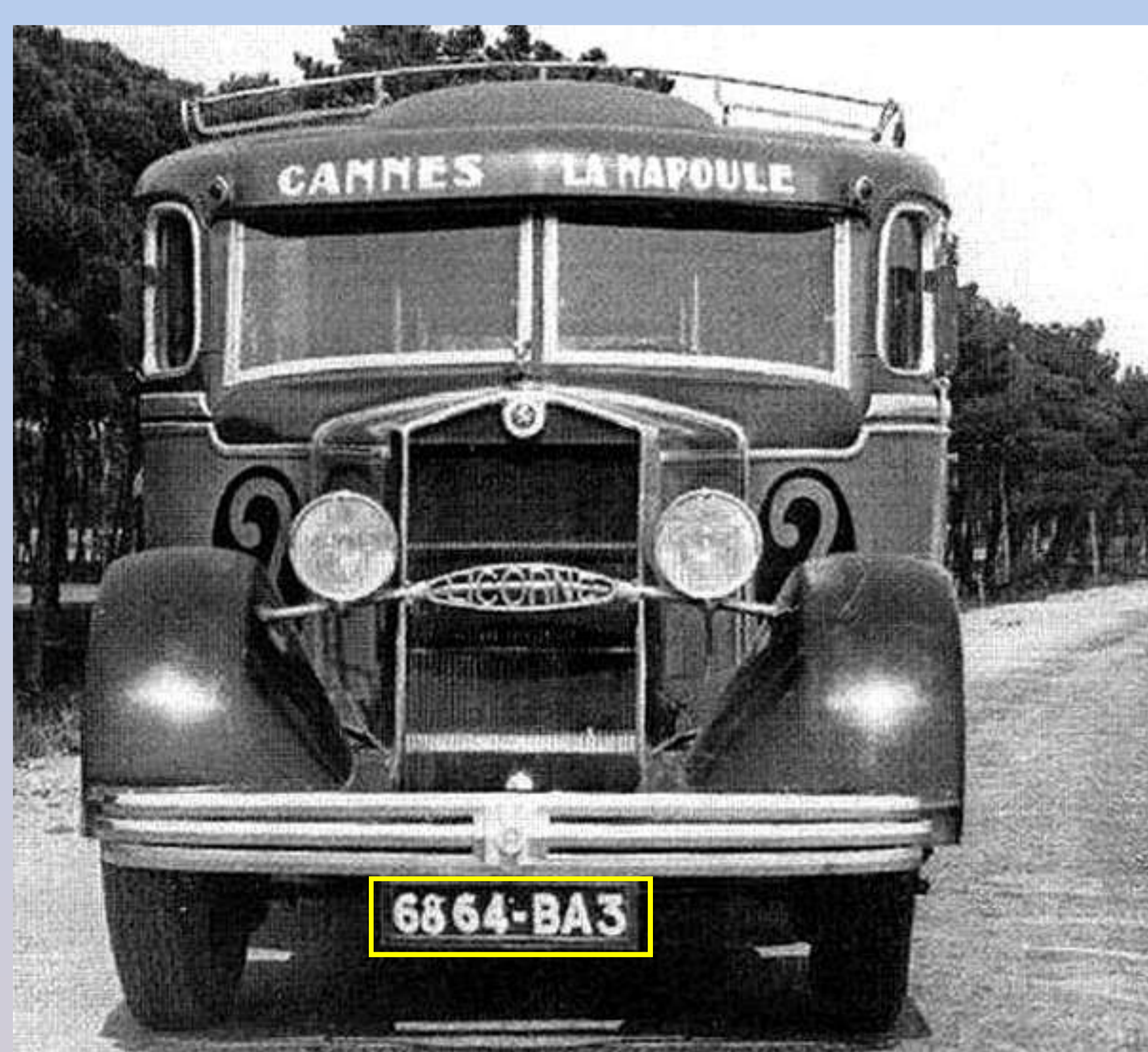
BA3 : Alpes-Maritimes, septembre 1933