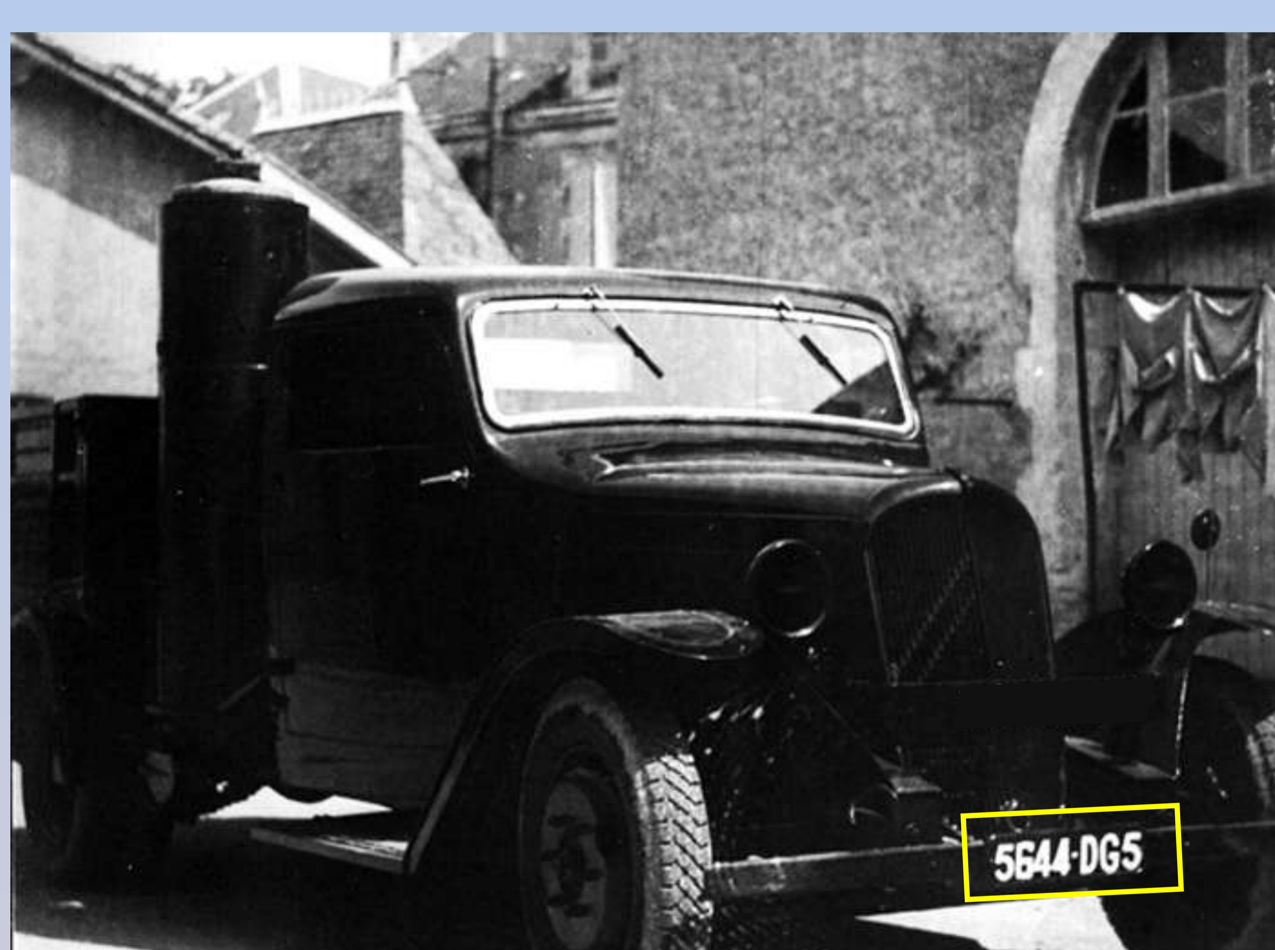
DG5 : Charente-Inférieure, 1940

trication à utiliser à partir du 1 er octobre prochain, il conviendra d'observer rigoureusement la répartition indiquée dans le tableau ci-annexé donnant, par groupe de deux lettres accolées, les caractéristiques spéciales à chaque département. Ces diverses combinaisons de lettres devront être employées dans l'ordre où elles figurent sur le tableau. Chacune d'elles permet l'ouverture de dix séries de 9.999 numéros, les lettres caractéristiques pouvant être utilisées avec ou sans un indice numérique d'un seul chiffre. C'est ainsi que les lettres caractéristiques AB donnent naissance aux séries de numéros :