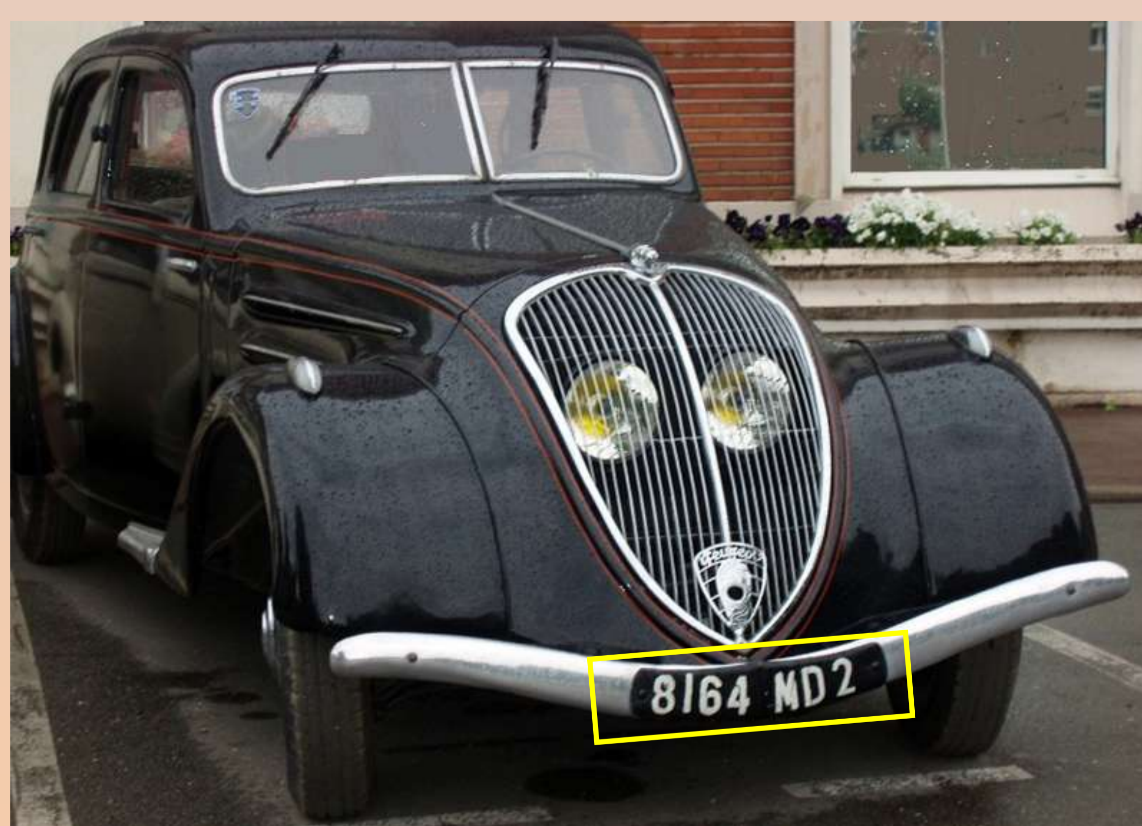
MD2 : Nord, octobre 1936

Extrait de la Circulaire du 30 avril 1928