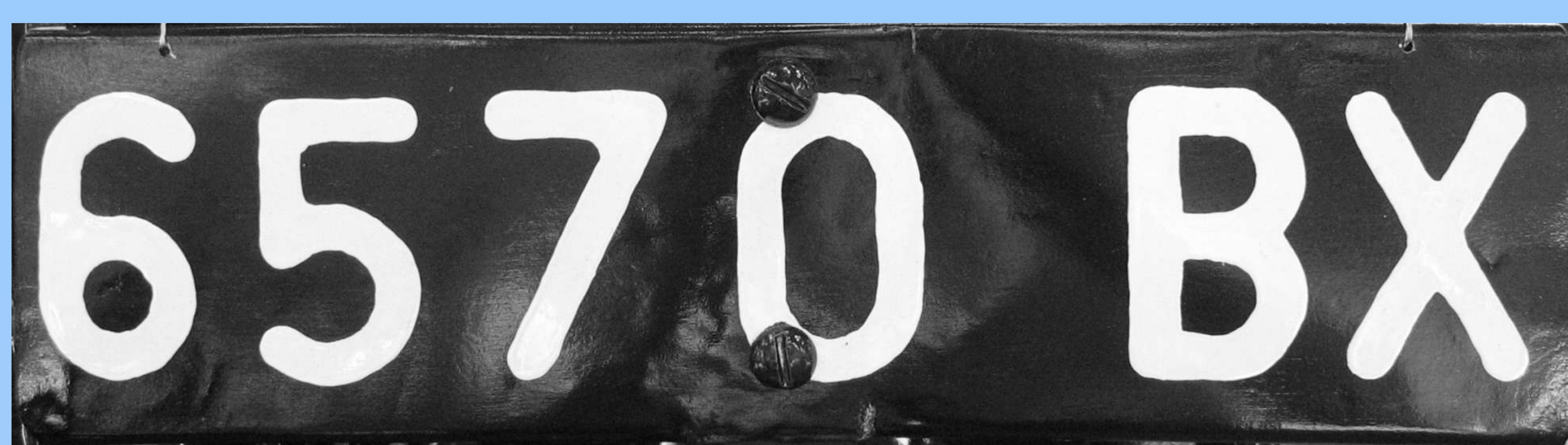
BX : Aveyron, décembre 1930

Le système mis en place en 1928 a corrigé les imperfections de celui de 1901. Les immatriculations ont été directement émises par chaque préfecture, les départements étant identifiés par un ou plusieurs groupes de deux lettres.